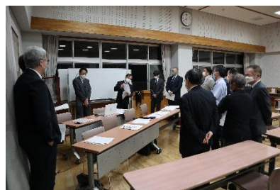
円陣を組んでの 第4回理事会と 新メンバー