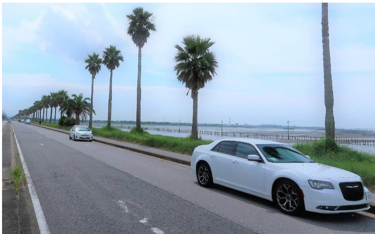
～千葉フォルニア（袖ヶ浦市）～