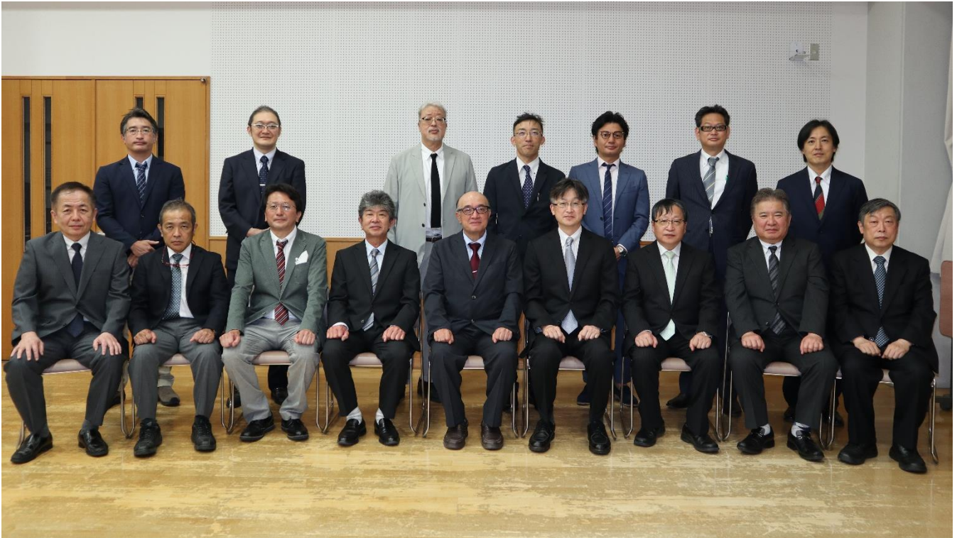
第2期原執行部（令和元～2年度） ～二年間、ありがとうございました～