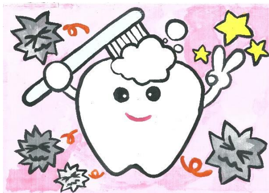
えのもと ひかる 榎本 光さん作