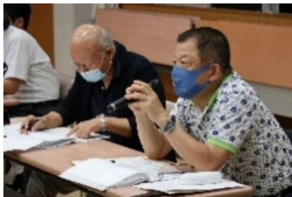
～市川顧問(右)と勝見会計担当理事(左)による質疑応答の様子～