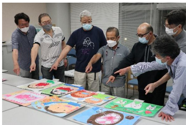
図画・ポスターを審査中の様子。理事会の後にも関わらず、お疲れ様でした。

来年度こそは大勢の前で表彰される児童、生徒の皆さんを見られたら、と思います。このような時期に、沢山の作品を提出して下さった各学校、標語を送って下さった一般の方々に心よりお礼申し上げます。