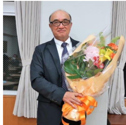
原会長、四年間ありがとうございました！