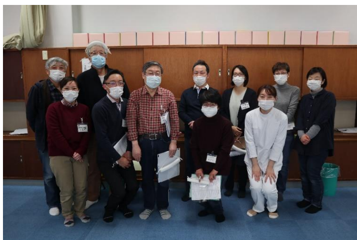
撮影日/ 令和3年3月12日 令和2年度第5回 摂食・嚥下指導より

指導後、昼食の際には園児の食べているものと同じ昼食を摂ります。普通食を食べ、ペースト食も味見します。実際に園児と同じ食事を食べてみると食材の硬さやペーストの柔らかさなどが、よくわかります。いつも医院で食べている昼食より量が少ないですがこれも貴重な経験です。その後ビデオを見ながら午後のミーティングを行います。数年前からはここにあゆみ園の調理師、栄養士さんも参加してくれるようになりました。園児たち一人一人の食形態や硬さ、テストフードについて一緒に検討してもらえ事は指導にとっても良い影響を与えています。普通食が食べられない園児に対して、刻み食を出している所もいまだにあるようですが、愛児園ではペースト食の硬さ柔らかさを調整して園児に出しています。歯科医師を中心として、歯科衛生士、看護師、言語療法士、調理師、栄養士などのスタッフ全員で摂食を考えていくという良い形が出来あがった事は、前回の園の紹介の時にも書きましたが事業の成果と考えております。なかなか困難苦勞の多い事業ですが、園児が食べ物を適量かじり取り、咀嚼し安全に嚥下できるようになると、保護者と同様うれしさを感じます。袖ヶ浦では障がい者施設の閉鎖が検討されているようですが、君津木更津歯科医師会の摂食・嚥下指導事業が継続発展していくことを願います。