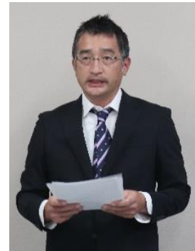
松葉社保担当理事