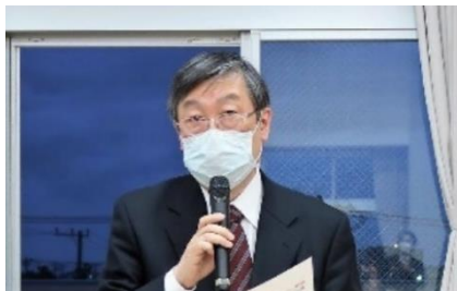
成川国保組合会議員